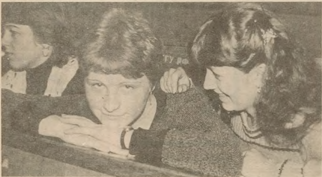
групай у кіно, тэатры, на дыскатэкі. Разам веселей сустракаць святы, лягчэй пераадо-